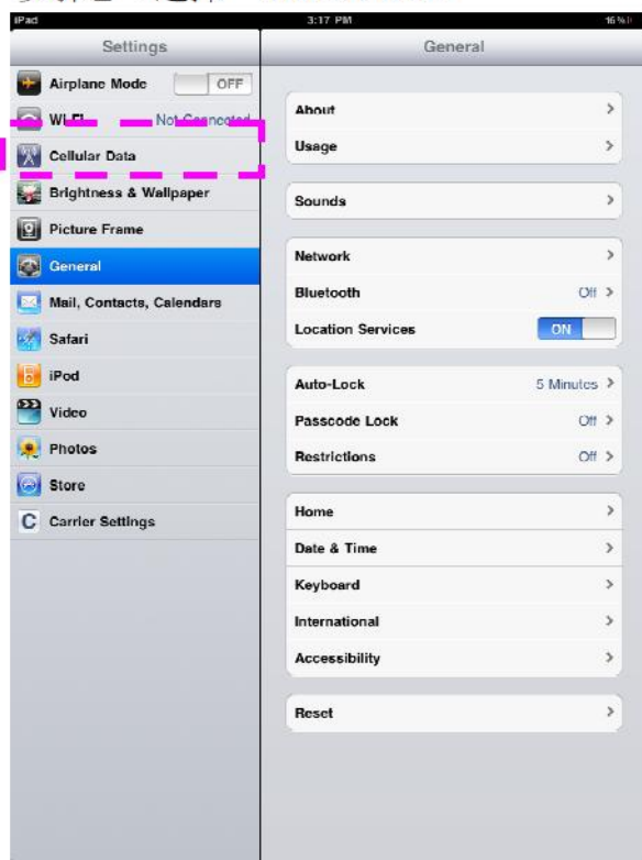
步驟 2：選擇 “Cellular Data”