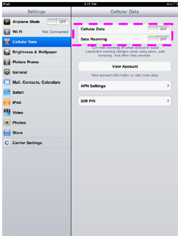
步驟 3：啓動 “Cellular Data” 及 “Data Roaming”